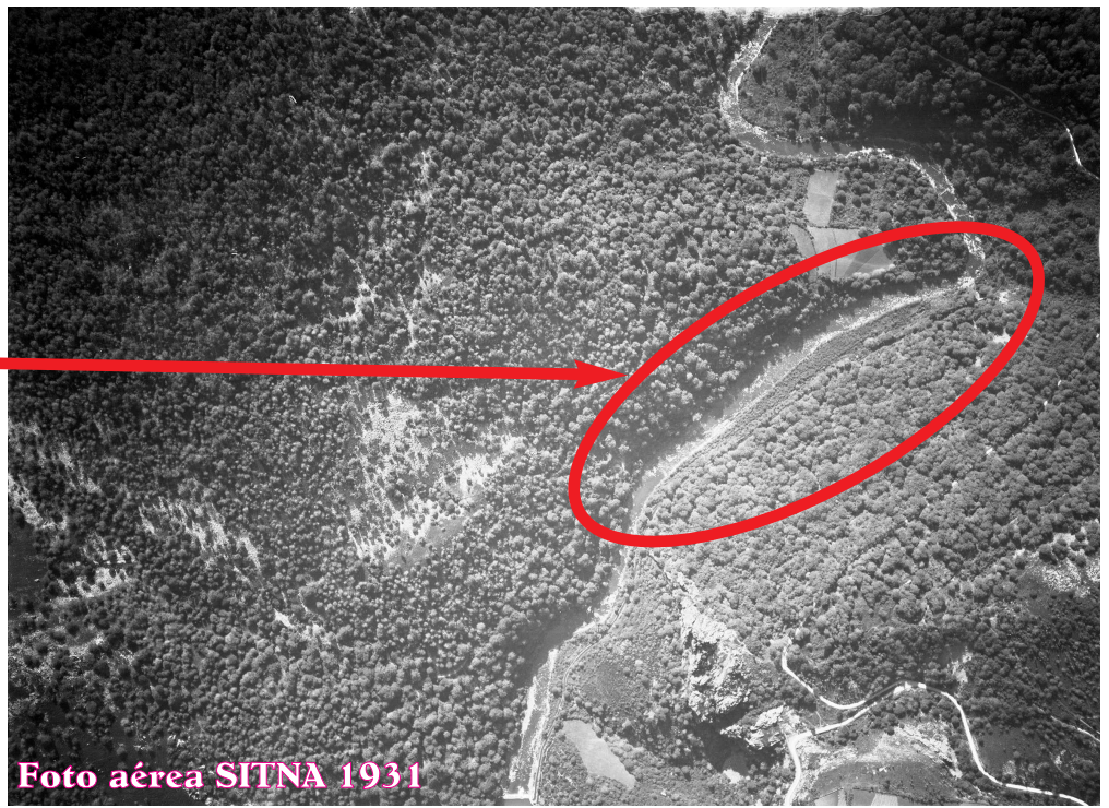
Foto aérea SITNA 1931